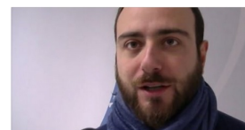
INDUSTRIA PADOVANA VERSO IL 2018: SEGNALI POSITIVI

Monito ai partiti: "prima di fare promesse elettorali, ricordatevi che sono i nostri soldi". #FabbricaPadova centro studi di Confapi sul gettito fiscale del territorio "cinque volte il Molise, più del doppio della Basilicata".